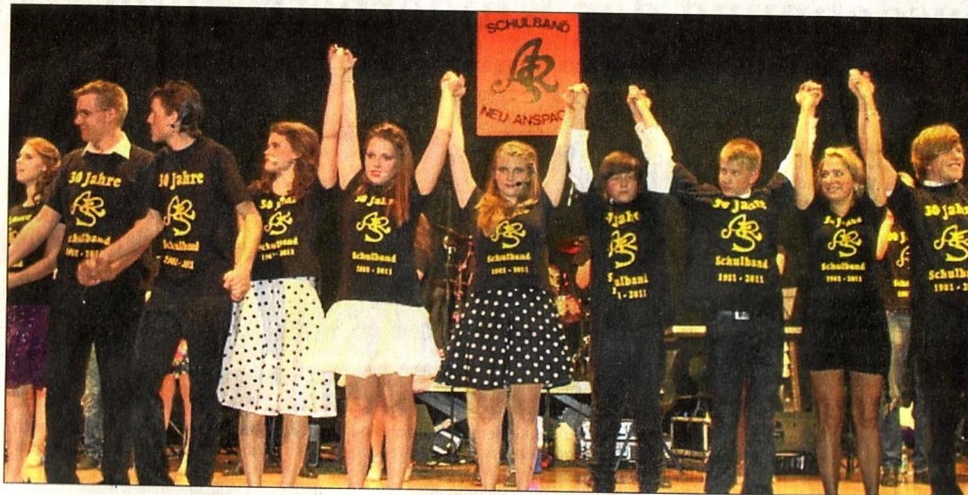
Die ARS Schulband – eine Erfolgsgeschichte.